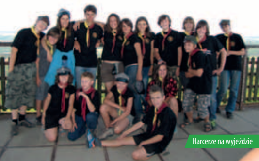
Harcerze na wyjeździe