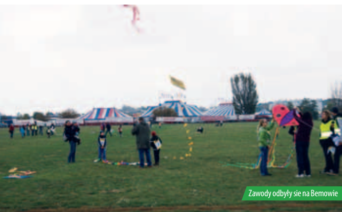
Zawody odbyły się na Bemowie

W niedzielę 7 października nad Warszawą pojawiły się kosmiczne rakiety, zielone meduza, japońskie smoki i orły.