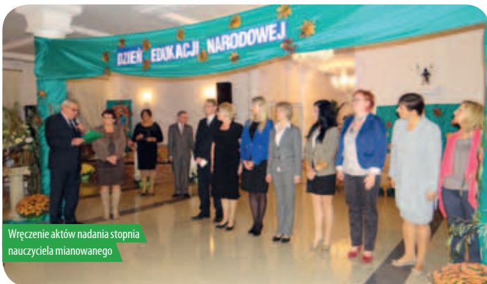
Wręczenie aktów nadania stopnia nauczyciela mianowanego