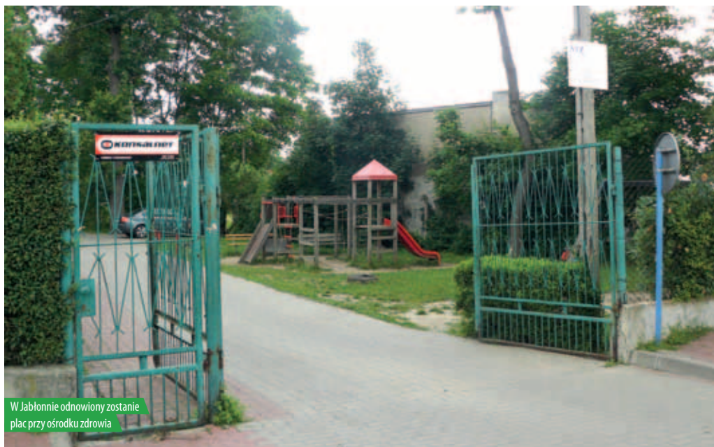
W Jabłonie odnowiony zostanie plac przy ośrodku zdrowia