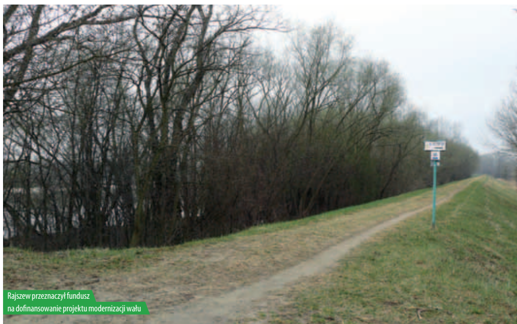
Rajszew przeznaczył fundusz na dofinansowanie projektu modernizacji wału