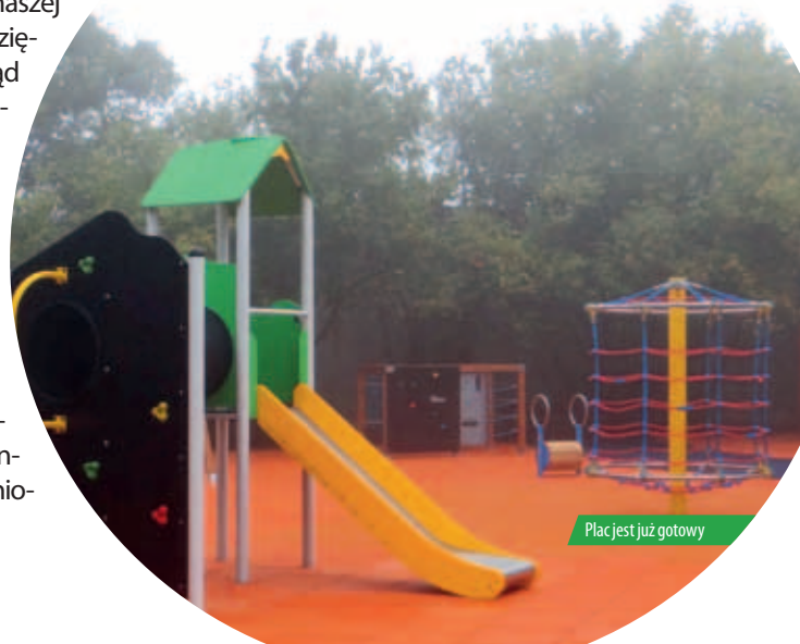
Plac jest już gotowy

Budowa w Chotomowie była możliwa dzięki pozyskanej przez Urząd Gminy dotacji. Kwota dofinansowania która pozwoliła na sfinansowanie 50% kosztów wyniosła 115 tys. zł.