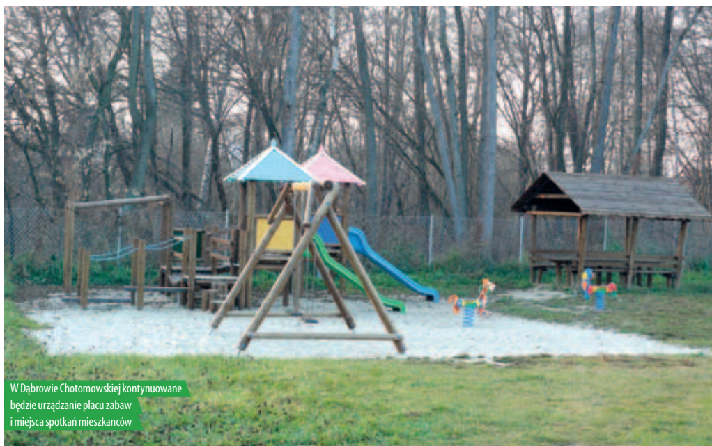
W Dąbrowie Chotomowskiej kontynuowane będzie urządzenie placu zabaw i miejsca spotkań mieszkańców