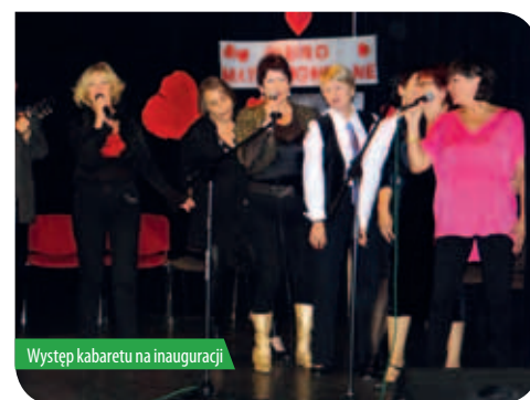
Występ kabaretu na inauguracji