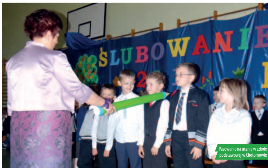
Pasowanie na ucznia w szkole podstawowej w Chotomowie