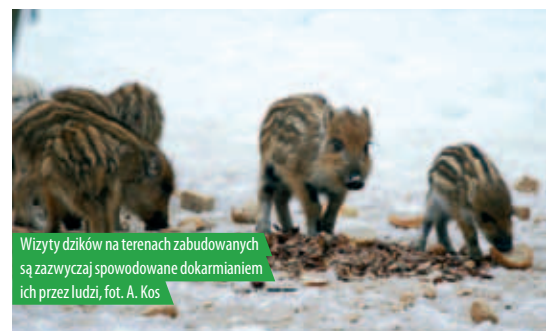
Wizyty dzików na terenach zabudowanych są zazwyczaj spowodowane dokarmianiem ich przez ludzi

W Referacie Ochrony Środowiska w urzędzie można otrzymać repelent odstraszający dziki. Osoby zainteresowane mogą się zgłosić do referatu w godzinach otwarcia urzędu: pok. nr 6, I piętro. Należy przynieść ze sobą pojemnik o pojemności 250 ml ze spryskiwaczem. W przypadku pytań lub wątpliwości prosimy o kontakt z pracownikami Referatu Ochrony Środowiska Urzędu Gminy Jabłonna, tel. (22) 767 73 29 lub 767 73 24.