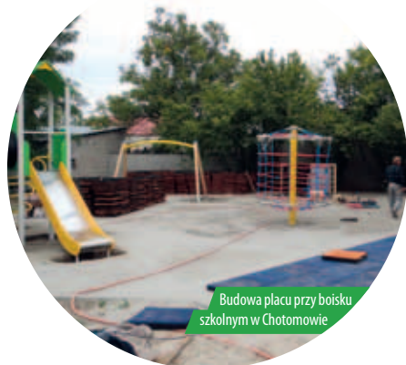
Budowa placu przy boisku szkolnym w Chotomowie

Zakończyła się budowa placu zabaw przy Szkole Podstawowej w Chotomowie. Plac powstał w ramach programu „Radosna Szkoła”.