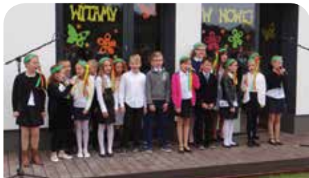
Uczniowie powitali nowy rok szkolny ze śpiewem na ustach

1 września rozpoczął się rok szkolny 2014/2015. Pierwszy dzwonek po wakacyjnej przerwie usłyszało 2805 uczniów gminnych placówek oświatowych.