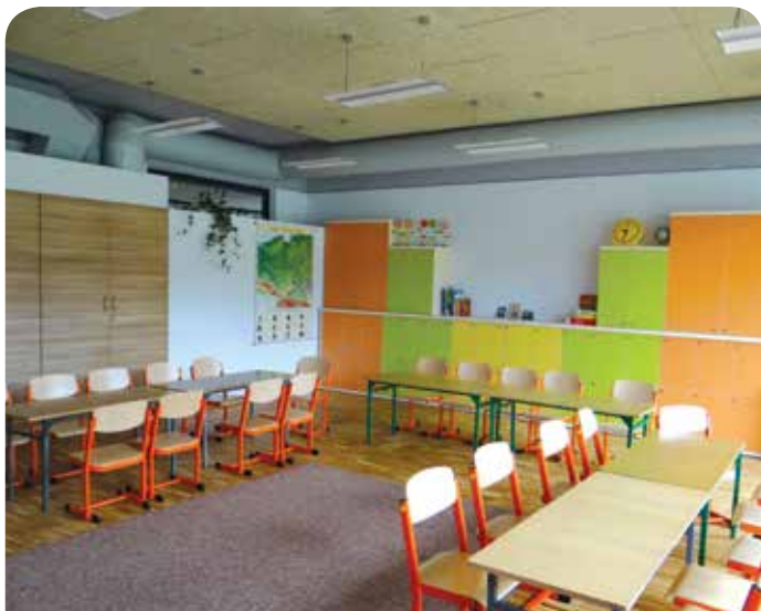
Kolorowa i przyjazna sala lekcyjna

dziewiątą elektrownią słoneczną, jaką Greenpeace przekazało szkołom w Polsce w 2014 roku i przy okazji największym trackerem w Polsce.