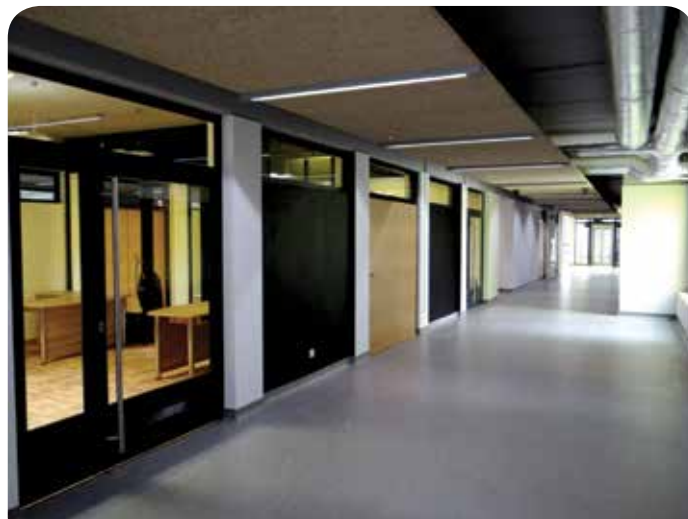
Na czarnych ścianach uczniowie mogą malować kredą

Greenpeace Polska, międzynarodowa organizacja działająca na rzecz poszanowania środowiska naturalnego, doceniła mieszkańców Chotomowa. Dzięki ufundowanej przez Greenpeace instalacji fotowoltaicznej o mocy 8 kWp, zainstalowanej na trackerze słonecznym, (urządzeniu, które podąża za ruchem słońca), szkoła