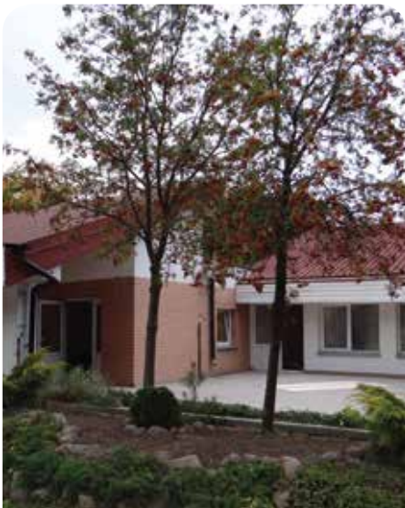
Budynek wymagał podjęcia radykalnych kroków

Warto przypomnieć: 26 marca 2014 r. Rada Gminy Jabłonna podjęła decyzję o utworzeniu Przedszkola Gminnego w Jabłonce. Gminny budynek przy ul. Modlińskiej 103b po 10 latach wrócił do dyspozycji właściciela. Przez dekadę w budynku mieściło się prywatne przedszkole, teraz działalność będzie prowadziła gminna placówka dla najmłodszych mieszkańców.