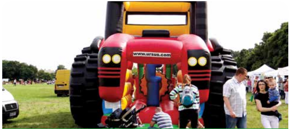
Głównym sponsorem imprezy był URSUS