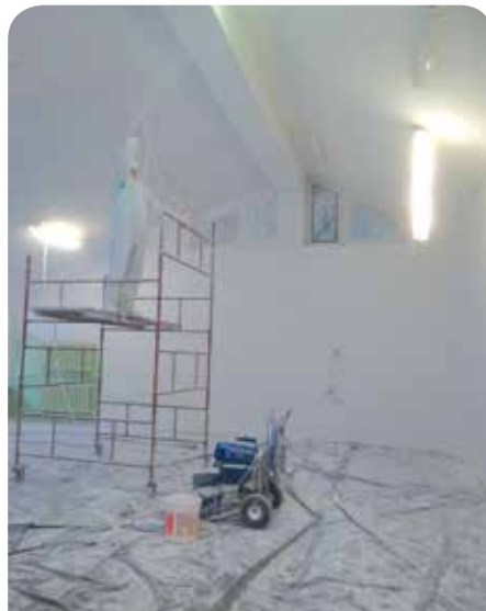
Malowanie ścian i sufitów