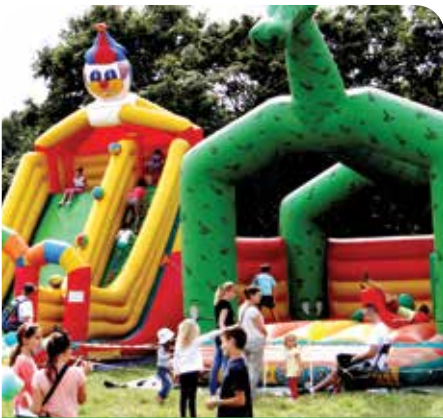
Na dzieci czekały bezpłatne atrakcje