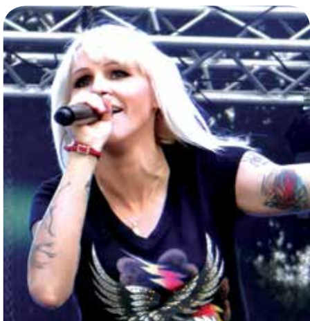
Agnieszka Chylińska świętowała w Jabłonce 20-lecie na scenie

Jabłonna hucznie zakończyła wakacje. W ostatnią niedzielę sierpnia na terenie zespołu pałacowo-parkowego Polskiej Akademii Nauk obchodzono Święto Gminy. Pośród wielu atrakcji przygotowanych przez organizatorów imprezy największą był koncert Agnieszki Chylińskiej, która na jabłonowskiej scenie świętowała jubileusz 20-lecia działalności artystycznej.