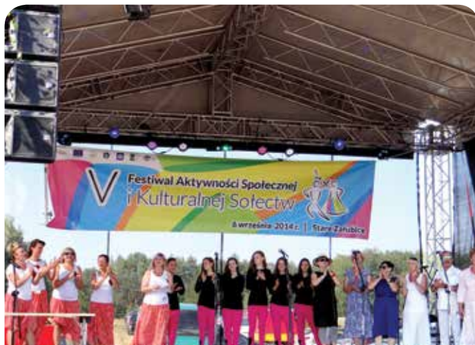
Na scenie wystąpił grupa Moderato i grupa Reflex

Nagrodę grand prix festiwalu zdobyło sołectwo Jadwisin co oznacza, że gospodarzem przyszłorocznego festiwalu będzie gmina Serock. Dziękujemy i gratulujemy wszystkim osobom zaangażowanym w przygotowanie stoiska i występu artystycznego sołectwa Jabłonna.