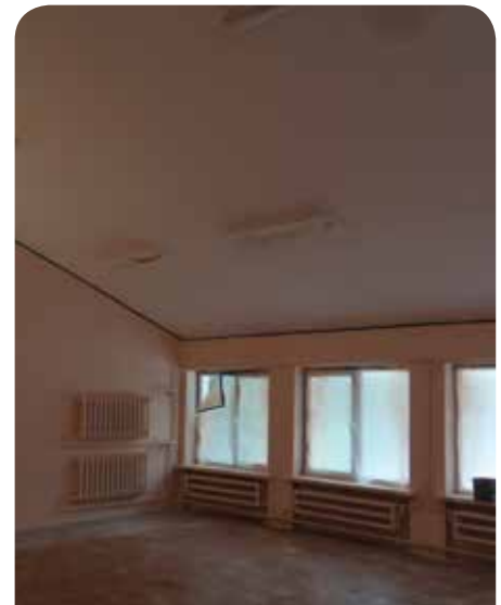
Ściany zostały wyrównane gładzią szpachlową