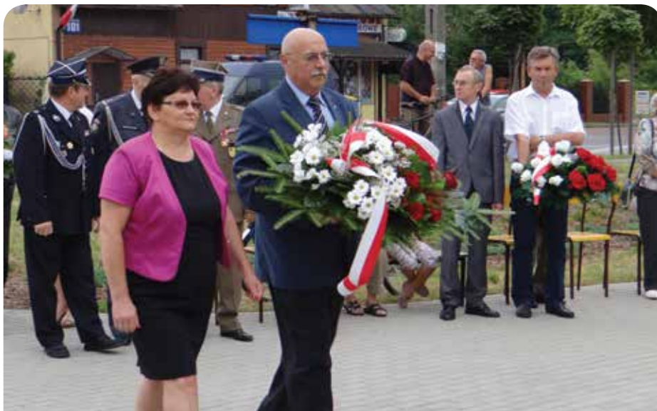
W 70. rocznicę wybuchu Powstania Warszawskiego złożono wieńce pod pomnikiem w Jabłonce

– „San Remo” nur fur Deutsche, w restauracji w Jabłonce również chętnie odwiedzanej przez Niemców, kantynach, kinach. Np. w kinie legionowskim przeprowadzaliśmy tzw. Akcję „Gaz”. Podczas seansu wrzucało się tzw. śmierdziela- tłącą się kliszę fotograficzną, a w tym czasie na ścianach kin rozlepialiśmy ulotki „Tylko świnie siedzą w kinie”.