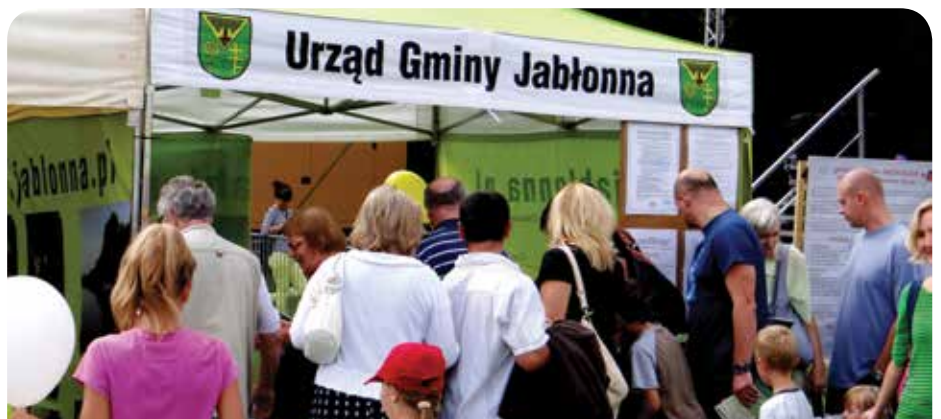
Stanowisko Urzędu Gminy Jabłonna