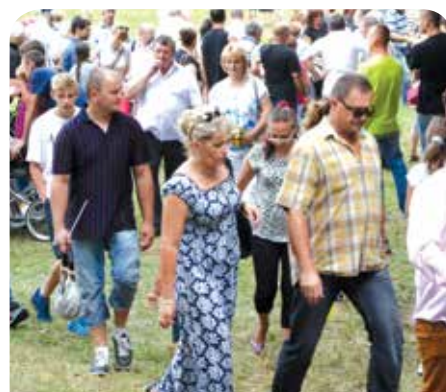
Mieszkańcy Chotomowa licznie wzięli udział w obchodach Święta