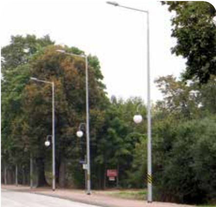
Latarnie wzdłuż ul. Chotomowskiej w Jabłonie oświetlają zarówno ulicę jak i chodnik

Oświetlenia ulic, budowa chodnika, budowa i wykonanie projektów sieci kanalizacyjnej oraz budowa boiska – to tylko niektóre ze zrealizowanych w ostatnim czasie gminnych inwestycji. Nim nadejdzie zima jeszcze wiele będzie się działo w naszej gminie Jabłonna.