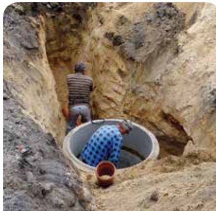
Budowa kanalizacji na ul. Listopadowej

Ulica Listopadowa, położona na granicy Jabłony i Legionowa, zostanie wyremontowana jeszcze w 2014 r. Inwestycja współfinansowana przez obie Gminy już się rozpoczęła. Wykonawca robót został wprowadzony na budowę. Podczas sierpniowych Sesji, Radni obu Gmin podjęli decyzję o zwiększeniu środków finansowych po 50 tys. zł na realizację inwestycji. Zwiększenie było konieczne, ponieważ Gmina Legionowo dwukrotnie ogłaszała przetarg, jednak po otwarciu ofert okazało się, że środki zabezpieczone w budżetach obu gmin na realizację zadania są niewystarczające. Zwiększenie dotacji celowej dla Gminy Miejskiej Legionowo do 350 000 zł umożliwiło miastu podpisanie umowy na realizację zadania do końca roku.