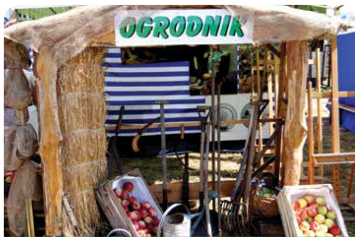
Stoisko Jabłony nawiązywało do tradycji ogrodniczych