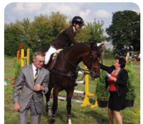
Wójt i Przewodniczący Rady Gminy nagrodzili zwycięzców turnieju