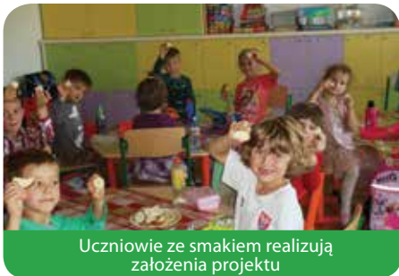
Uczniowie ze smakiem realizują założenia projektu

Zerótkowicze ze Szkoły Podstawowej im. S. Krasińskiego w Chotomowie, mają zaszczyt uczestniczyć w prozdrowotnym polsko – szwajcarskim programie pt: „Zapobieganie otyłości wśród dzieci w wieku szkolnym KiK 34”.