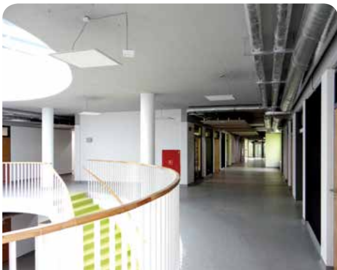
Na piętrze ważną rolę odgrywa naturalne oświetlenie

W nowoczesnym i przestronnym budynku uczniowie będą mieli komfortowe warunki do rozwoju intelektualnego i fizycznego. Nowa szkoła to pierwszy krok do powstania Centrum Edukacyjno – Kulturalno – Sportowego w skład którego wejdzie między innymi szkoła podstawowa, gimnazjum, dom kultury i biblioteka.