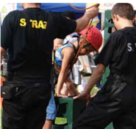
Strażacy przygotowali atrakcje dla odważnych