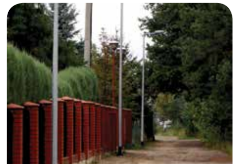
Nowe lampy na ul. Okólnej w Chotomowie