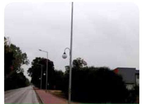
Nowe latarnie wzdłuż chodnika prowadzącego do nowej szkoły