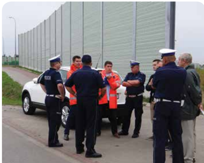
Uczestnicy spotkania poświęconego bezpieczeństwu na obwodnicy

Mamy nadzieję, że wprowadzone zmiany znacznie poprawią bezpieczeństwo na tej drodze. Warto jednak pamiętać, o czym często