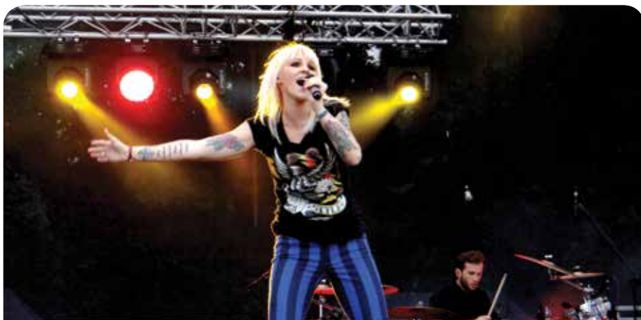
Gwiazda wieczoru porwała publiczność

Organizatorami tegorocznej imprezy była Gmina Jabłonna, Starostwo Powiatowe w Legionowie i Gminne Centrum Kultury i Sportu. Partnerem wydarzenia była firma Ursus S.A. Patronat medialny sprawowały Wieści z Naszej Gminy, Kurier, Gazeta Powiatowa, Radio Hobby, Gazeta Lokalna Legio Extra i Portal Legio24.pl