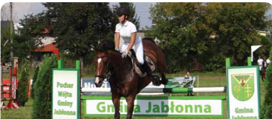
Turniej jeździecki o Puchar Wójta Gminy Jabłonna