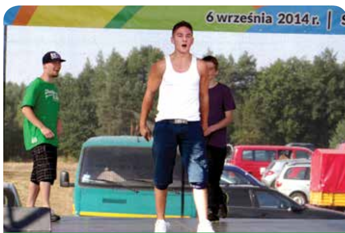
Olbrzymie zainteresowanie wzbudził występ Cojones Grandes Crew