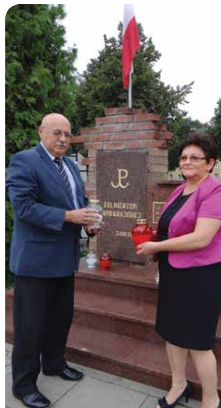
Wójt Gminy wraz z zastępcą zapaliła znicze pod pomnikiem

W pierwszych dniach powstania druh harcmistrz St. Godlewski zdecydował rozpoczęcie „Akcji –N” w ramach tego zadania podrzucaliśmy na tereny garnizonów różnego rodzaju ulotki, odezwy, znakomicie wydrukowane po niemiecku w imieniu fikcyjnych organizacji podziemia antyhitlerowskiego np. świetnie wydana broszura „Der Grosste lunger der Welt” (największy głama świata) i inne. Podrzucaliśmy te materiały np. w restauracjach w Legionowie