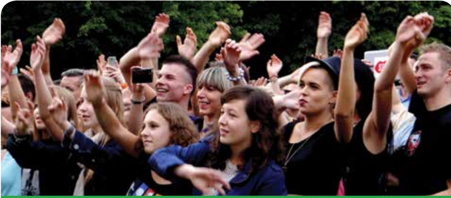
Koncert główny przypadł publiczności do gustu