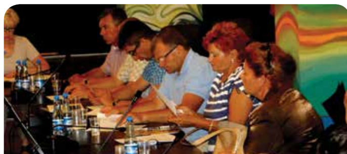
Radni wyrazili dezaprobatę dla podziału powiatu na okręgi wyborcze

Uchwała Rady Gminy Jabłonna oraz działania mieszkańców gminy, nie zdołały zmienić podziału przyjętego przez Radę Powiatu Legionowskiego. W listopadowych wyborach samorządowych, mieszkańcy gmin Jabłonna i Wieliszew wybiorą 6 wspólnych przedstawicieli, którzy przez kolejne 4 lata będą reprezentować w Radzie Powiatu interesy obu gmin.