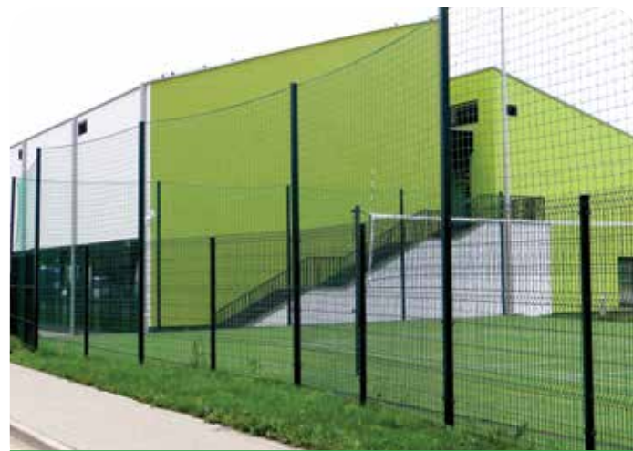
Obok szkoły funkcjonują dwa boiska