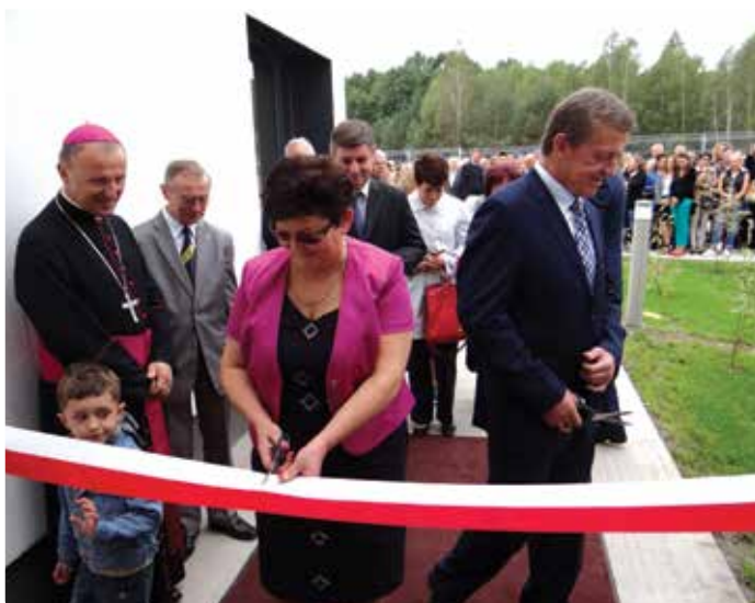
Symboliczne przecięcie wstęgi

Największa gminna inwestycja została ukończona. 1 września o godzinie 11.00 odbyło się otwarcie nowej, energooszczędnej szkoły podstawowej w naszej gminie. Zastosowane rozwiązania przy budowie szkoły sprawiają, że jest to jeden z najnowocześniejszych i wysoce energooszczędnych budynków użyteczności publicznej na Mazowszu.