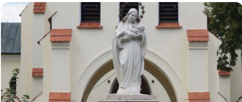
Święto Chotomowa to także odpust parafialny