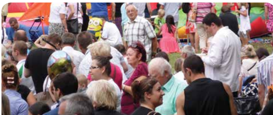
Z roku na rok liczba świętujących wzrasta