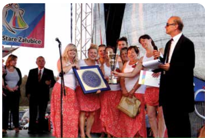
Nasze sołectwo zdobyło I miejsce w kategorii występ sceniczny