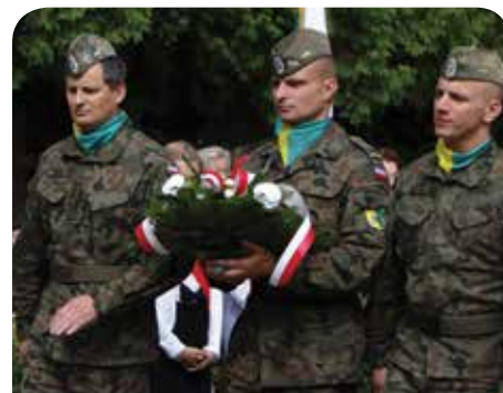
Żołnierze 32. dywizjonu raketowego Obrony Powietrznej

Uroczystości, jak każdego roku, odbywały się przy grobie zbiorowym 39 Żołnierzy Polskich poległych pod Jabłonną w walce zbrojnej z Niemcami we wrześniu 1939 r. Zbiorowa mogiła, w której spoczywają żołnierze 21. Pułku Piechoty „Dzieci Warszawy” znajduje się na cmentarzu parafialnym w Jabłonce.