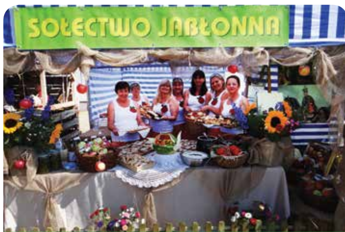
Stoisko sołectwa Jabłonna