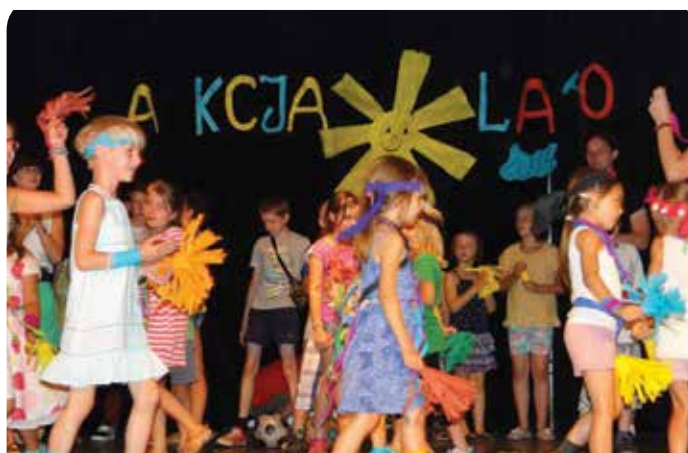
Dzieci radośnie zakończyły Akcję Lato

Organizatorzy Akcji zadbali o bezpieczeństwo i przyjazną atmosferę. Opiekę nad dziećmi sprawowali wykwalifikowani opiekunowie i animatorzy.