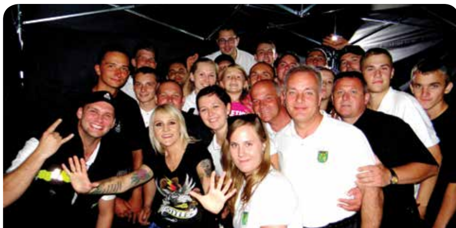
Chylińska zaprosiła strażaków do wspólnego zdjęcia

Gwiazdą tegorocznej imprezy była Agnieszka Chylińska, która w trakcie koncertu jubileuszowego „20 lat na scenie”, zaśpiewała między innymi takie utwory jak: Znalazłam („Teraz, teraz, teraz”), Drzwi („Nie mogę zasnąć...”), Nie