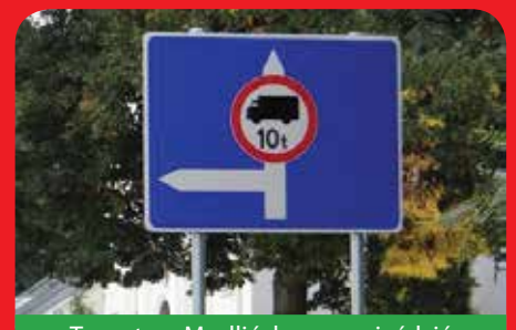
Tzw. starą Modlińską mogą jeździć samochody o wadze do 10 ton

Od 4 września 2014 r. na ul. Modlińskiej w Jabłonie na odcinku od ul. Zegrzyńskiej do Ronda Biskupów Płockich obowiązuje ograniczenie tonażowe. Ze wskazanego odcinka ul. Modlińskiej mogą korzystać pojazdy o wadze do 10 ton. Pojazdy przekraczające ten tonaż jadące od Nowego Dworu Mazowieckiego do Warszawy dojeżdżając do centrum Jabłony muszą kierować się ul. Zegrzyńską na rondo Maurycyego Potockiego h. Pilawa i dalej obwodnicą Jabłony, droga z Warszawy w kierunku Nowego Dworu Mazowieckiego przebiega analogicznie – obwodnica, ul. Zegrzyńska, ul. Modlińska w str. Nowego Dworu Mazowieckiego.